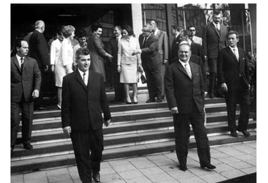
Nikolae Čaušesku i Josip Broz (28. 5. 1968)