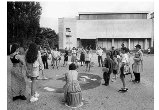
„Može i ovako” na Trgu galerija (3. 6. 1995)