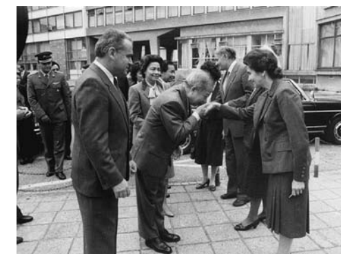
Predsednik Kampučije Norodom Sihanuk (13. 10. 1987)