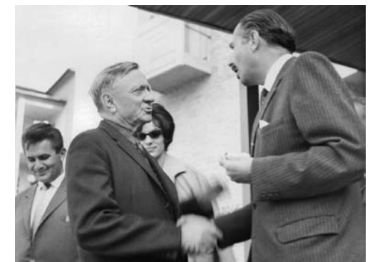
Poseta Vilijama O. Daglase (1961)