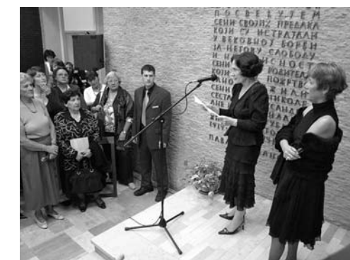
Vida Ognjenović otvara izložbu Risto Stijović (21. 9. 2006)