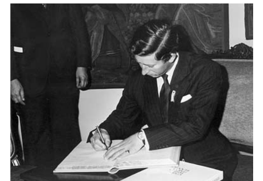
Princ Čarls se upisuje u Knjigu utisaka Spomen-zbirke (27. 10. 1978)