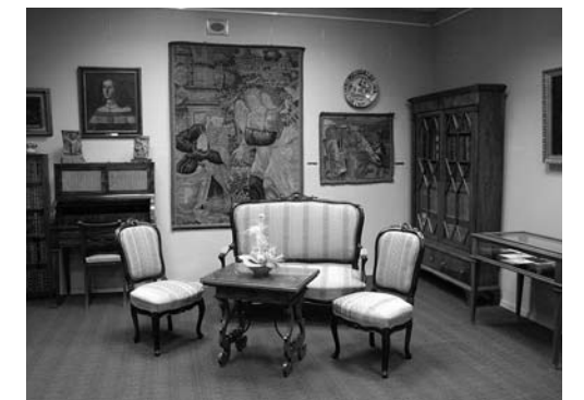
Memorijal Pavla Beljanskog (2003)