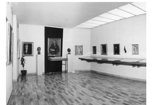
Izgled Memorijala umetnika 1977. godine