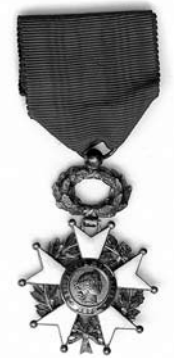
Orden Legije časti (1927)